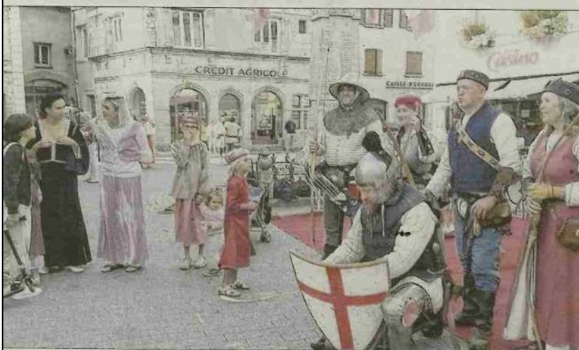
■ Les archers d'Usson-en-Forez étaient présents à cette fête médiévale.

CONTACT Association du Patrimoine vivant, Tél. 04.77.52.84.76.