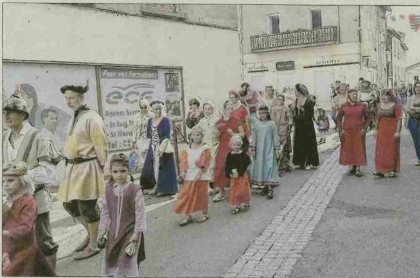
■ Un défilé coloré en costumes d'époque.

Pendant les Journées du Patrimoine, l'association du Patrimoine vivant a organisé une fête médiévale dans les rues du village. Ce retour dans le passé moyenâgeux a débuté, dimanche, par le traditionnel défilé en costumes d'époque, accompagné par les archers d'Usson-en-Forez. Des ateliers de calligraphie, de