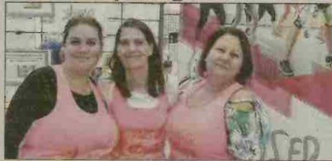
■ Des adhérentes de Danser bouger Bouger, avant une démonstration de Zumba.

Bernard-Rouby, chaque mercredi de 15 à 16 heures pour les ados et de 20 h 45 à 21 h 45 pour les adultes. Moyennant 90 euros de cotisation pour l'année, les adhérents (il n'y a pas beaucoup d'hommes) sont accueillis par Lauryne, la professeure, qui dirige les cours dans une ambiance familiale et décontractée. Pas d'esprit de compétition entre filles, seulement le plaisir de se déhancher sur de la musique et de se faire plaisir le temps d'une soirée. Le premier mois de cours est gratuit en ce début de saison.