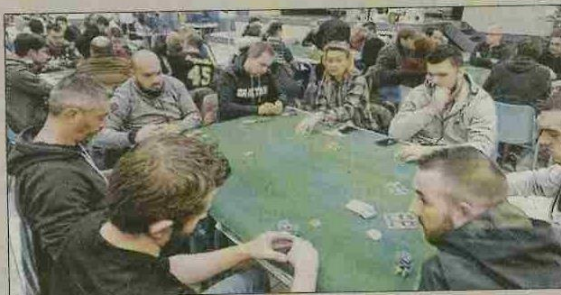
■ Deux cents joueurs sont venus participer au tournoi de poker.