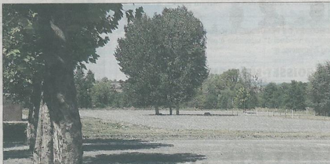
PUCES MARCELLINOISE. L'espace du moulin, réhabilité par les services communaux début 2017, est plus grand et offre plus de places de parking.

■ Quel rapport y a-t-il entre les pucés et l'Assen ? Dans cette période où la tendance au gaspillage est