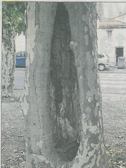
■ Un platane creux, rongé de l'intérieur.