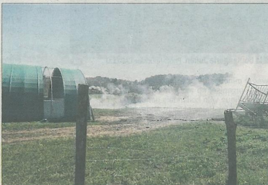
■ L'écobuage est une source de nuisance importante.

PRATIQUE Plus d'infos en mairie, Tél. 04.77.36.10.90.