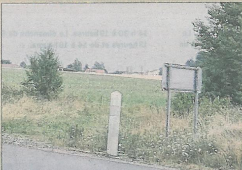
■ C'est entre l'arbre et le panneau que le chemin des agriculteurs sera créé.

Prochainement, les agriculteurs ne seront plus obligés d'emprunter le rond-point du Placier et la RD498 pour rejoindre le chemin des petites Farges. Un vrai plus pour ceux de la commune qui, avec leurs engins imposants, sont contraints de faire des détours par la route principale et les inconvénients de circulation qui vont avec.