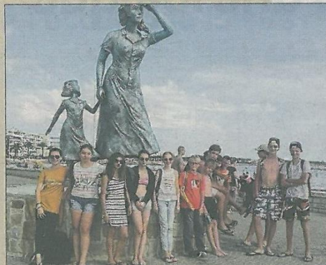
■ Sport, visites, baignade et soleil au menu des vacances.