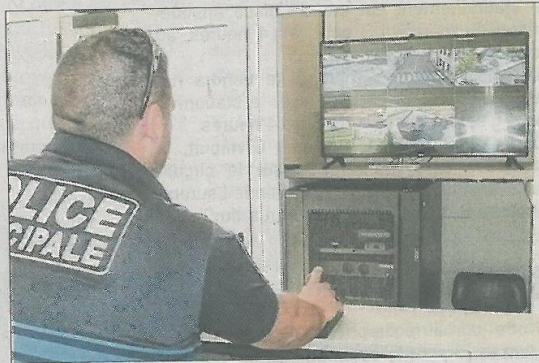
■ Un dispositif efficace visionné par la police municipale.