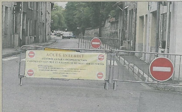
■ Une banderole suffisamment explicite installée par l'ASSEN.