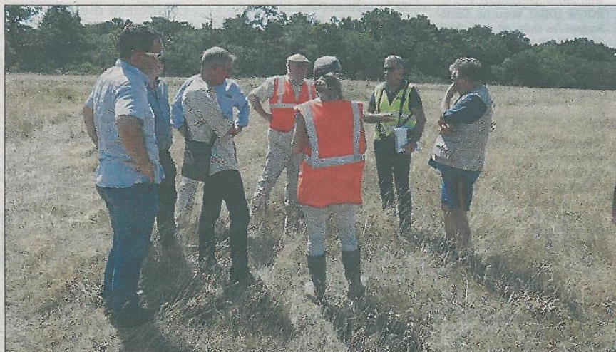
SITE DE TRÉMOLIN. Différents intervenants ont fait le point sur le développement de la biodiversité sur le site de l'ancienne décharge.

Lors de la réunion in situ , les participants ont