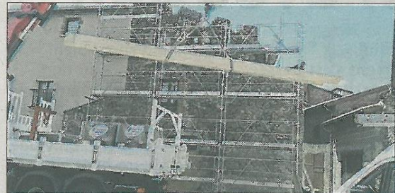
■ De gros moyens déployés pour installer la nouvelle toiture.

SAINT-MARCELLIN-EN-FOREZ Nouvelle toiture pour la future maison des expositions