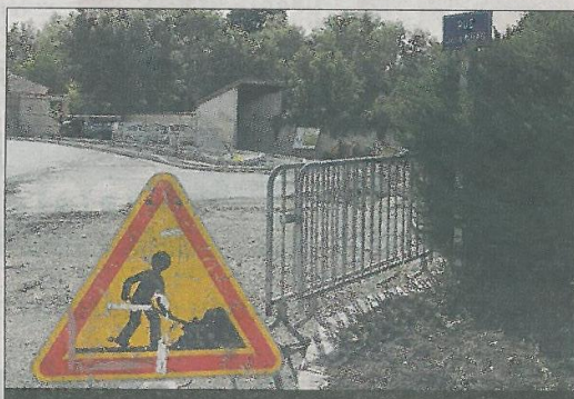
CHANTIER. La rue Carles-de-Mazenod est concernée par les aménagements programmés par la municipalité.

La municipalité a mené ou va mener plusieurs chantiers d'ici à la fin de l'année. Trois sites sont concernés.