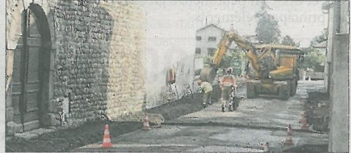
■ La rue Carles-de-Mazenod pendant les travaux.

En travaux depuis le 24 juillet, la rue Carles-de-Mazenod a subi des travaux qui ont nécessité sa fermeture avec la mise en place d'un sens de circulation et des feux tricolores. Des travaux conséquents qui ont permis la mise en place des trottoirs, dont un aux normes pour personnes à mobilité réduite (minimum 1,40m de largeur). Dans quelques jours l'entreprise de travaux publics terminera la fin de la rue avec un traitement particulier des trottoirs voulu par les architectes des Bâtiments de France. La mise en place d'un arrêt de bus avec le déplacement devant les anciens services techniques, ainsi que la modification de l'entrée du parking compléteront les travaux. D'ici là, la rue a été rouverte à la circulation.