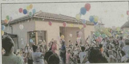
■ Un lâcher de ballons haut en couleur.

Pour bien finir l'année scolaire, les membres du Sou des écoles se sont mobilisés pour organiser, vendredi, dans la cour de l'école maternelle, la traditionnelle fête de l'école. Vers 20 heures, un lâcher de ballons a coloré le ciel et terminé ainsi cette manifestation. Avant cela, en début d'après-midi, les enfants des Temps d'activités périscolaires (TAP) et les intervenants ont présenté au gymnase un spectacle composé de danses et de chants, ainsi que des démonstrations sportives apprises tout au long de l'année.