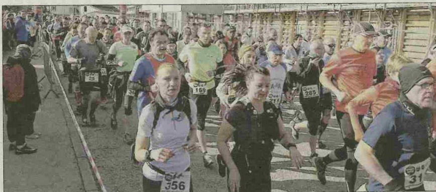
488 coureurs au départ du 14 km.