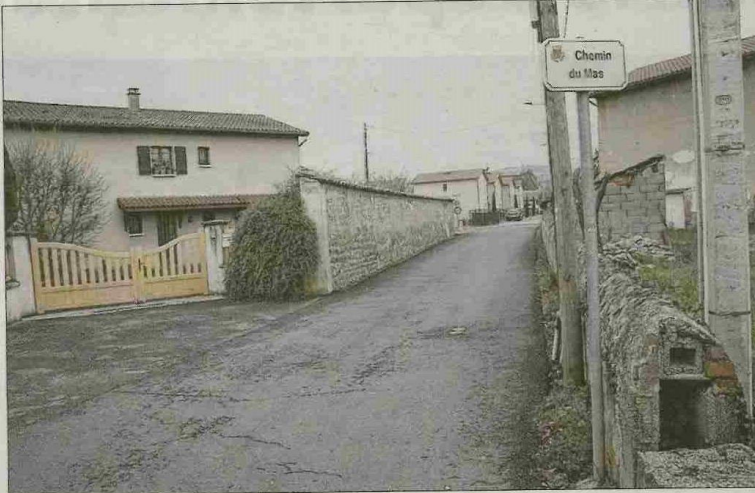
Les faits se sont déroulés chemin du Mas, à Saint-Marcellin-en-Forez.

Prenant conscience de son geste, elle aurait alors tenté de