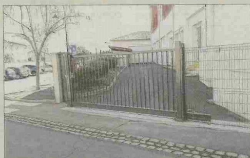
Ce nouveau portail va permettre de mieux sécuriser les lieux.

La municipalité a fait installer un portail à l'école mixte 1. Sans surveillance, cette impasse devenait parfois un lieu de rassemblement avec des risques d'accidents potentiels, voire de malveillance. Le but de cette installation étant de sécuriser le préau à vélo, le transformateur EDF, les locaux de l'école, mais aussi les entrées et sorties des véhicules pour la livraison du restaurant scolaire. C'est l'entreprise Seric qui a procédé au montage du grillage et du portail coulissant pour un montant de 6 914 euros TTC.