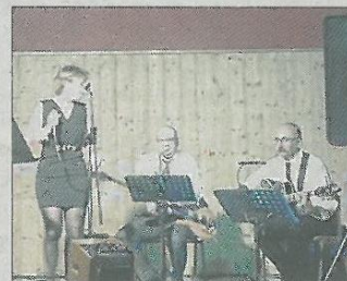
■ Le groupe Swing's team.

L'office municipal d'animation (OMA) présidé par Marc Combette, a organisé samedi soir en partenariat avec l'association de la Saint-Vincent, un spectacle musical à la salle Aristide-Briand. Le groupe Swing's team a, pour l'occasion, revisité les standards de la chanson française.