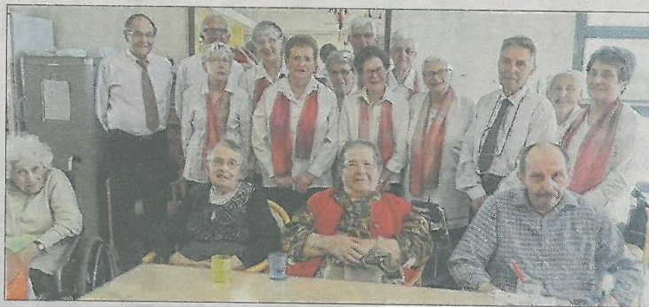
■ Des résidents de la maison les Bleuets avec la chorale de l'Amitié d'Andrézieux.

Jeudi, les membres de la chorale de l'Amitié d'Andrézieux ont rendu visite aux anciens de la maison de retraite les Bleuets. Dans leur répertoire, des chansons d'antan et de plus récentes ont ensoleillé cet après-midi musical. Si le soleil a brillé par son absence, le spectacle présenté a réchauffé le cœur des pensionnaires, ravis de fredonner les chansons et de partager le goûter avec la chorale. Un bel après-midi appelé à se renouveler tant les résidents étaient heureux.