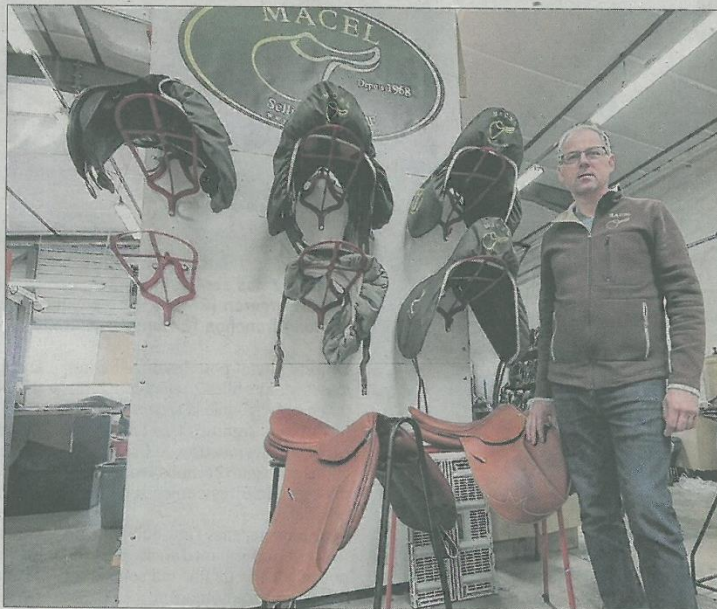
■ Les selles de couleur châtaigne, noir, brun foncé ou gold sont proposées autant aux particuliers qu'aux professionnels. Il faut déboursier entre 3 600 et 4 200 euros.