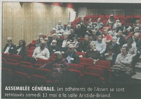
ASSEMBLÉE GÉNÉRALE. Les adhérents de l'Assen se sont retrouvés samedi 13 mai à la salle Aristide-Briand.

Cette année encore, le plus gros du budget de l'Assen a été dévolu à la réalisation des jardins familiaux et solidaires (22.000 €). Mis en place au printemps 2016, ils ont été finalisés ce printemps avec un deuxième abri de jardins, des toilettes sèches, une serre et la plantation d'arbres fruitiers (lire à ce sujet notre édi-