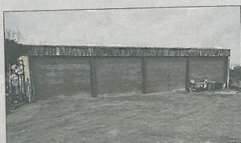
■ Les anciens bâtiment des services techniques seront démolis.

Pour son programme de renouvellement annuel, la commune va rempla-