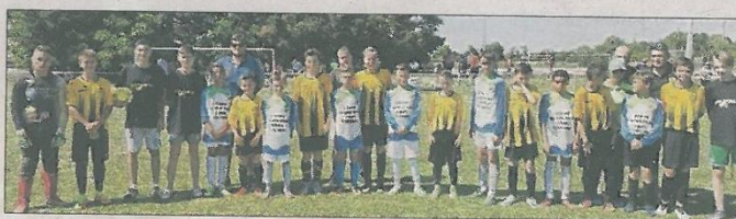
■ Les jeunes du FCM (en jaune) prêts pour jouer la finale.