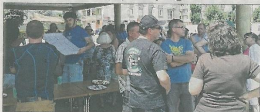
■ Tout a commencé par un apéritif offert par les quinze associations participantes.

SAINT-MARCELLIN-EN-FOREZ Plein succès du 5 e pique-nique géant