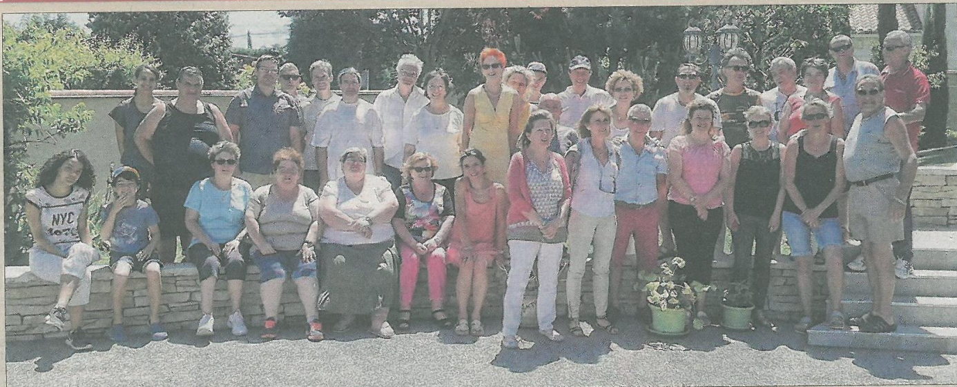
■ Le repas des voisins : une tradition qui perdure pour les résidents du chemin d'Acquinton.