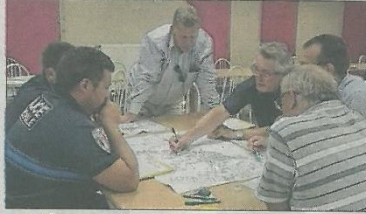
■ Différents scénarii étudiés ont été étudiés.

Le changement important concerne l'entrée de l'école maternelle qui se fera à partir du boulevard du Couhard avec un parvis sécurisé et un parking de 45 places. Un chemin piétonnier va tra-