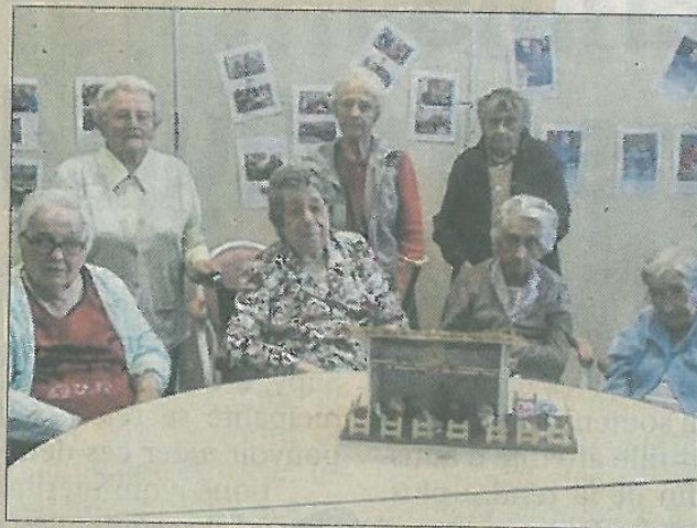
■ Une création à mettre à l'actif des résidents.

Les résidents de la maison de retraite Les Bleuets ont souhaité s'investir sur des activités ayant trait aux fêtes de Noël. Avec l'équipe animation, les pensionnaires ont réalisé une crèche avec du carton plume, des carrés de liège, de la feutrine, des capsules de café, des bâtonnets de glace et de la pâte fimo argileuse. Cette création ne restera pas longtemps à la résidence puisque les aînés ont souhaité en faire don à la commune de Viverols (Puy de Dôme). Celle-ci organise, chaque année, une exposition réunissant près de 200 crèches. Elle se tiendra du 8 décembre au 8 janvier.