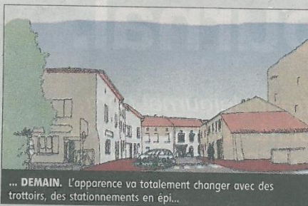
... DEMAIN. L'apparence va totalement changer avec des trottoirs, des stationnements en épi...

Un grand plan de travaux sur les voies publiques a débuté l'été dernier (voir notre édition du 10 août) dans le centre du village.