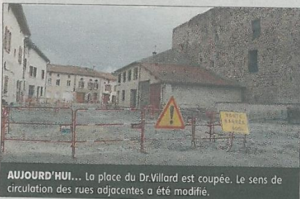
AUJOURD'HUI... La place du Dr.Villard est coupée. Le sens de circulation des rues adjacentes a été modifié.