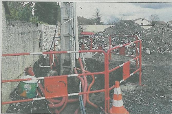
■ Les travaux ont débuté boulevard du Couhard.