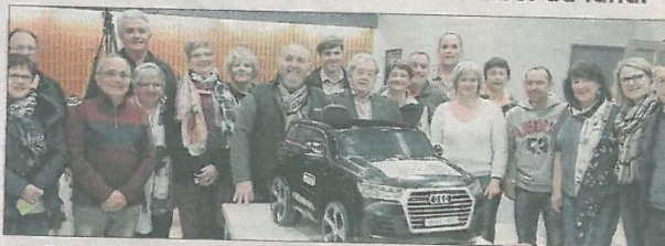
■ Le Père Noël du lundi et la Pantomime autour du cadeau offert aux enfants.

La soirée théâtrale organisée, samedi, à la salle Bernard-Rouby, par le Père Noël du lundi a connu un joli succès. Les spectateurs ont beaucoup ri devant la pièce jouée gracieusement par la troupe Pantomime, Cabinets de crise . Une comédie de Michel le Dall, qui a, pour l'occasion, laissé ses droits à l'association du Père Noël du lundi. Les fonds récoltés serviront à l'achat de matériels, et de cadeaux pour les enfants hospitalisés de la Loire. Le président Gagnière et son équipe ont présenté au public leur dernière acquisition destinée au service de pédiatrie de l'hôpital de Firminy : une petite voiture électrique (Audi Q7). Elle permettra aux enfants de se rendre au volant de la voiture, soit au bloc, soit dans la salle de soins. Un achat effectué avec l'aide du conseil municipal des enfants de Fraisses.