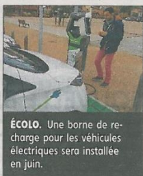
ÉCOLO. Une borne de recharge pour les véhicules électriques sera installée en juin.

L'analyse rétrospective a montré qu'en moyenne les dépenses réelles de fonctionnement de la municipalité ont baissé de 1,3 %