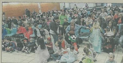
■ Les enfants ont eu un spectacle de magie.

Samedi après-midi, le Sou des écoles avait donné rendez-vous aux enfants et aux parents afin de participer au carnaval. Les enfants sont venus déguisés à la salle Bernard-Rouby, où les attendait le magicien professionnel Eric Dorey. Il a présenté un numéro mêlant humour, autodérision et dextérité, avant d'enchaîner avec un spectacle de ventriloquie avec sa marionnette Toyoyo. Il y avait également un coin goûter, avec crêpes, gâteaux et brochettes de bonbons... À l'issue du spectacle, les enfants, encadrés par les bénévoles du Sou des écoles, ont défilé dans les rues du village afin de regagner l'espace Le Moulin pour participer au grand fouga organisé par le comité des fêtes.