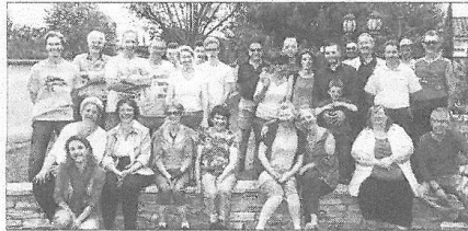
■ Plaisir et convivialité.

ST-MARCELLIN-EN-FOREZ Fête des voisins au chemin d'Acquinton