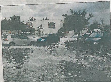
SAINT-CYPRIEN. Les fortes pluies ont entraîné de sérieuses inondations, samedi soir.

En vingt-cinq minutes à peine, des milliers de petites billes sont venues blan-