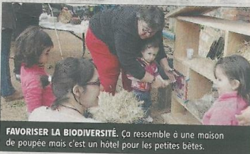
FAVORISER LA BIODIVERSITÉ. Ça ressemble à une maison de poupée mais c'est un hôtel pour les petites bêtes.

L'association FZM a proposé la réalisation aux enfants de réaliser un hôtel pour les insectes dimanche 6 juin, dans le cadre de la manifestation nationale Rendez-vous aux jardins.