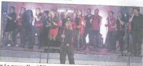
■ Le groupe Vocal Effect a mis de l'ambiance.

C'est dans une ambiance festive et colorée que s'est déroulée cette soirée musicale organisée, pour cause de pluie, à la salle Bernard-Rouby. Les groupes invités ont mis le feu pour faire chanter et danser les nombreux spectateurs présents. Une fête chaleureuse et visiblement appréciée.