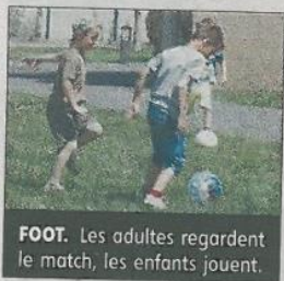
FOOT. Les adultes regardent le match, les enfants jouent.

Des barbecues étaient mis à disposition, des stands proposaient des boissons et, après manger, certains ont fait la sieste, quand d'autres s'acti-