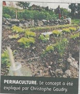
PERMACULTURE. Le concept a été expliqué par Christophe Gaudry.

Le terrain mis à disposition par la mairie est situé dans le quartier du Placier. Il permet de réaliser 36 parcelles de 100 m 2 . La réalisation de ce projet ne fait que débiter mais 17 parcelles ont déjà été mises à disposition.