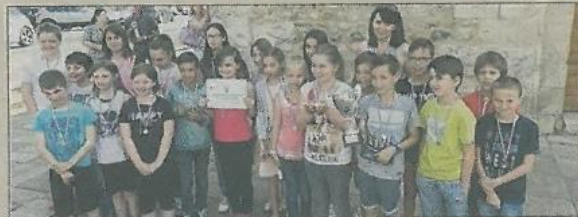
■ Les élèves de CM2 ont reçu chacun une médaille pour le concours national de poésie des donneurs de sang.