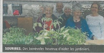
SOUIRES. Des bénévoles heureux d'aider les jardiniers.

Le troc et don de plantes de dimanche 5 juin n'aura jamais autant été apprécié. Dans le cadre de la manifestation Rendez-vous aux jardins, l'association Saint-Marcellin patrimoine vivant a permis aux jardiniers victimes de la grêle du week-end précédent de se fournir en