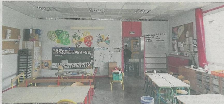
■ L'eau a traversé les faux plafonds de cette classe, endommagé le matériel et inondé le sol sur plusieurs centimètres.

Dans un premier temps, la municipalité avait songé à fermer les cinq classes inondées, avec à la clé le déplacement des 180 élèves dans différentes salles communales. Mais l'intervention rapide, efficace et coordonnée des services techniques de la commune et du personnel des écoles a permis dans un premier temps de sécuriser les lieux et de reloger les élèves dans la salle d'évolution et la petite bibliothèque. L'expert mandaté est venu constater l'étendue des dégâts et notamment les deux clas-