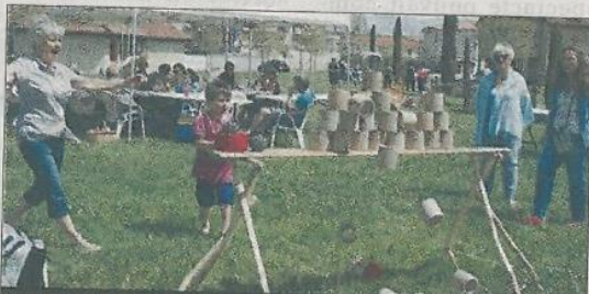
JEUX. De 7 à 77 ans, tout le monde s'est amusé.

Comme chaque année, l'association FZM organise un pique-nique géant intergénérationnel sur les pelouses de la salle des fêtes Bernard-Rouby. Beaucoup d'autres associations les aident pour l'organisation et l'animation de cette journée joyeuse, où chacun a apporté son pique-nique.