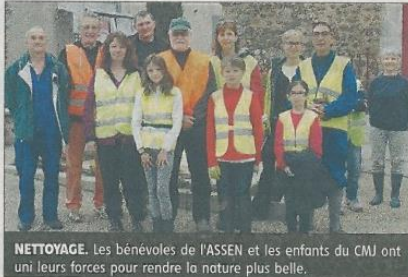
NETTOYAGE. Les bénévoles de l'ASSEN et les enfants du CMJ ont uni leurs forces pour rendre la nature plus belle.

L'Association de sauvegarde de l'environnement et de la nature, l'Assen, a, en partenariat avec le conseil municipal des jeunes, organisé samedi 4 juin un rendez-vous aux jardins écocitoyens au cours duquel il s'agissait de ramasser les ordures. En deux heures seulement, une vingtaine de bénévoles, enfants et adultes, ont rempli plus de vingt sacs poubelles.