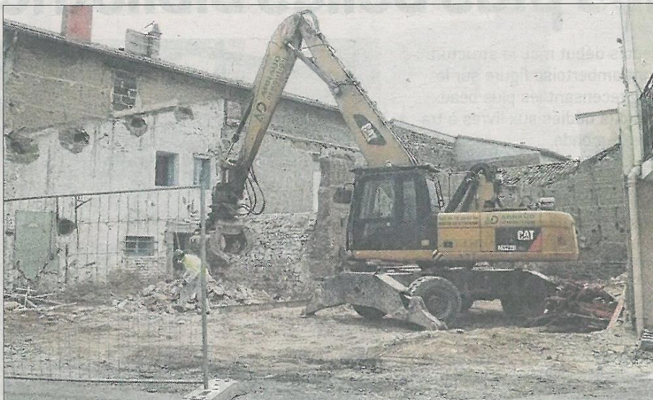
■ La pelleteuse en action rue du Docteur-Guinard.

Depuis quelques jours les travaux de démolition concernant l'ancien relais des postes ont débuté.